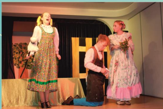
Химка, Бальзаминов и Раиса