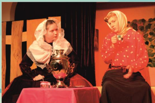
Бальзаминова и Матрена