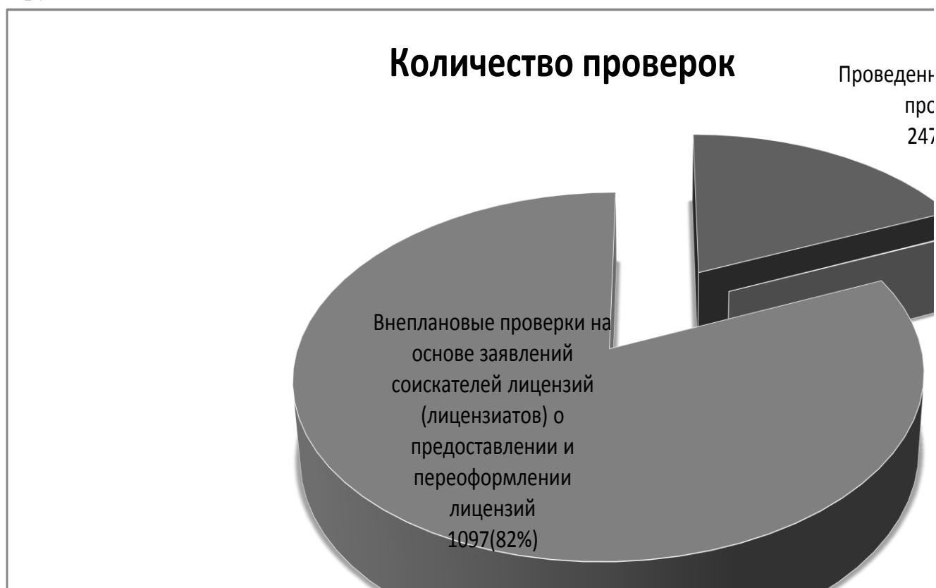
Рис.2 Доля проверок по лицензированию и лицензионному контролю, проведенных в 2021 году.

Нарушения лицензионных требований выявлены в ходе 4 плановых проверок. Количество случаев нарушений лицензионных требований, выявленных по результатам проверок, составило 4, из них 3 являются грубыми нарушениями.